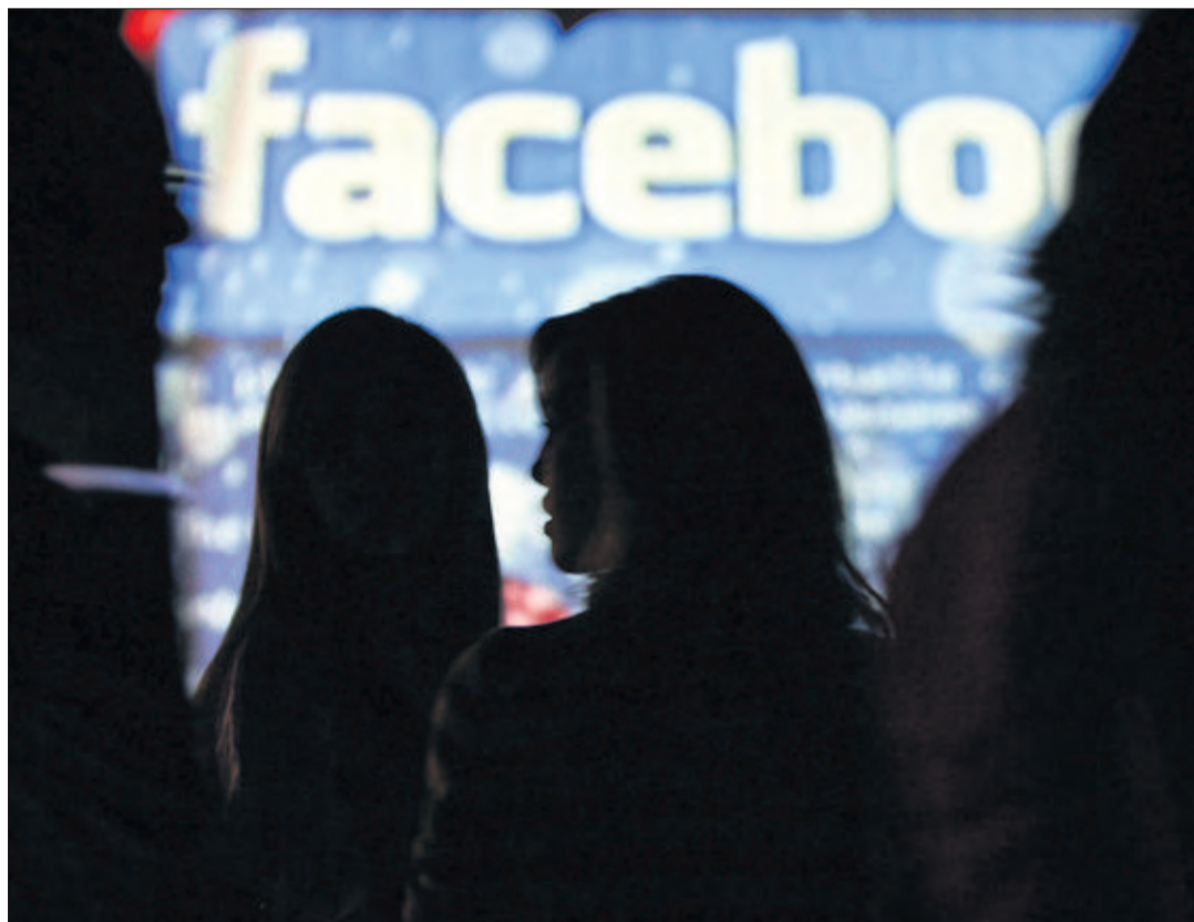
Parmi tous les réseaux, la suprématie de Facebook est désormais incontestable.