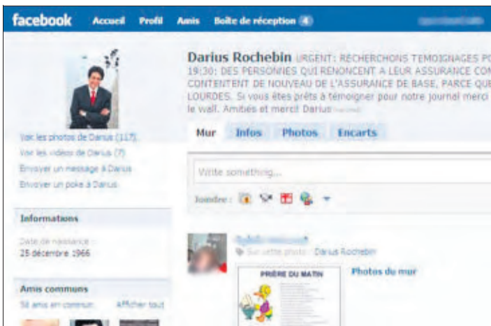
Plus de 10 000 «amis». Tel est le score actuel de Darius Rochebin. Très utile pour lancer des appels à témoins.