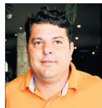
Michel Chevolet , journaliste et animateur radio et télé. (P. FRAUTSCHI)

«Michel Chevolet à la radio!» ou «Michel Chevolet résout des problèmes!» Le mur de l'animateur de Léman Bleu fourmille d'infos et de photos. «J'ai craqué le 1er novembre 2007. Aujourd'hui, j'ai 3300 amis et je trouve que c'est un outil de communication génial.» Et qui lui a apporté de belles surprises. «Le 15 novembre, j'ai reçu via Facebook un mail de mon demi-frère que je ne connaissais pas et qui vit aux Etats-Unis. On a ainsi pu se rencontrer au Nouvel-An en Uruguay.» Pratique pour lancer des invitations ou promouvoir ses émissions, Facebook l'a aussi embarqué dans une drôle d'aventure. «Quelqu'un avait posté une vidéo de moi en train de chanter. Les commen-