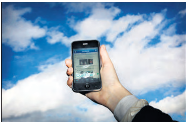
Les outils de communication modernes, tel l'iPhone, permettent de rester «connecté» en permanence. (PAOLO BATTISTON)